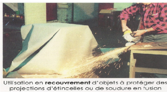
Utilisation en recouvrement d'objets à protéger des projections d'étincelles ou de soudure en fusion

Les tarifs sont à titre indicatif pour tout renseignements contactez nous